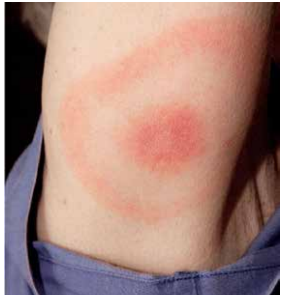
圖三 遊走性紅斑(erythema migrans, EM)

Steere 教授進行調查，根據發生的季節（晚夏、初秋）、其高度流行性以及關節炎出現前一個月有昆蟲叮咬的皮膚症狀，即所謂遊走性紅斑（erythema migrans, EM，圖三）等特徵，推測其為一種以昆