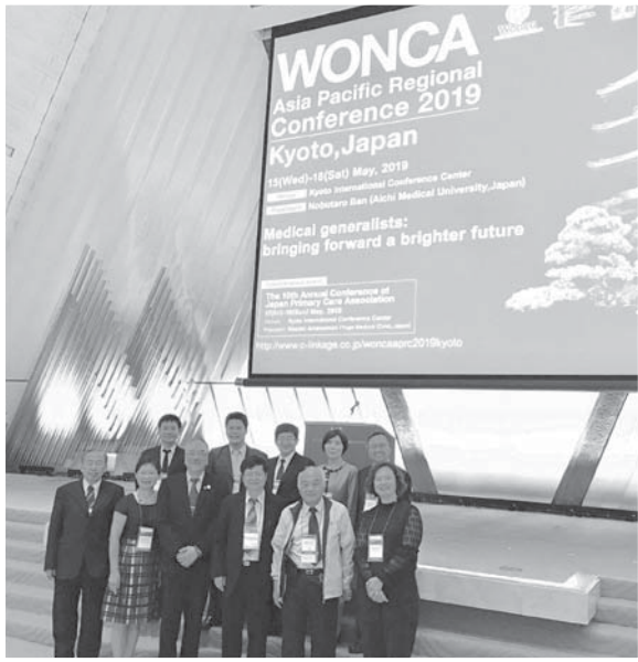
李孟智主席與來自台灣的與會者合影

擔任亞太區域秘書長，與世界衛生組織有相當緊密的聯絡和合作，為台灣爭取在國際上的能見度。在致詞後，頒獎亞太家庭醫學雜誌學術論文獎以及2019亞太五星醫師獎項。開幕式後的媒體專訪時間，則由NHK專訪李孟智主席，肯定本次會議的成功及日本家庭醫學發展的發展。