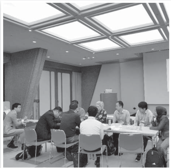
青年醫師於會場討論