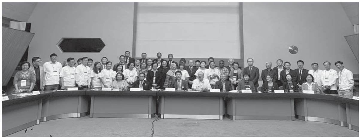
亞太區域會員代表大會(Council Meeting)與會人員合影

2020年亞太區域WONCA會議預定於4月23日到26日於奧克蘭(Auckland)舉辦。同年11月25日至29日在阿聯酋阿布達比(Abu Dhabi, UAE)舉行第23屆WONCA世界會議，有意參與的會員宜請提早準備。