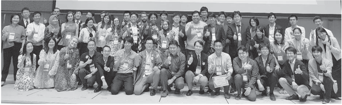
青年醫師會前會與會代表合影