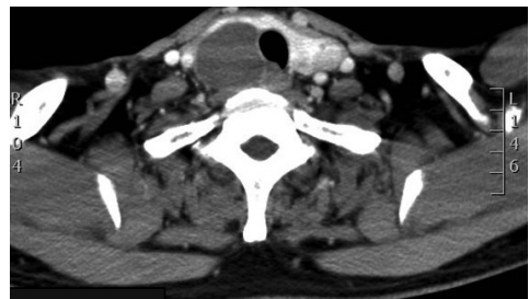
圖3 兩側多發性結節合併囊腫變化，無淋巴結腫大